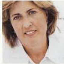
Elke maand een topontwerp voor de tuin, uitgezocht en toegelicht door groenexpert Loes Langendijk.

Je moet maar durven: doodgewone schutting wordt eyecatcher in paars