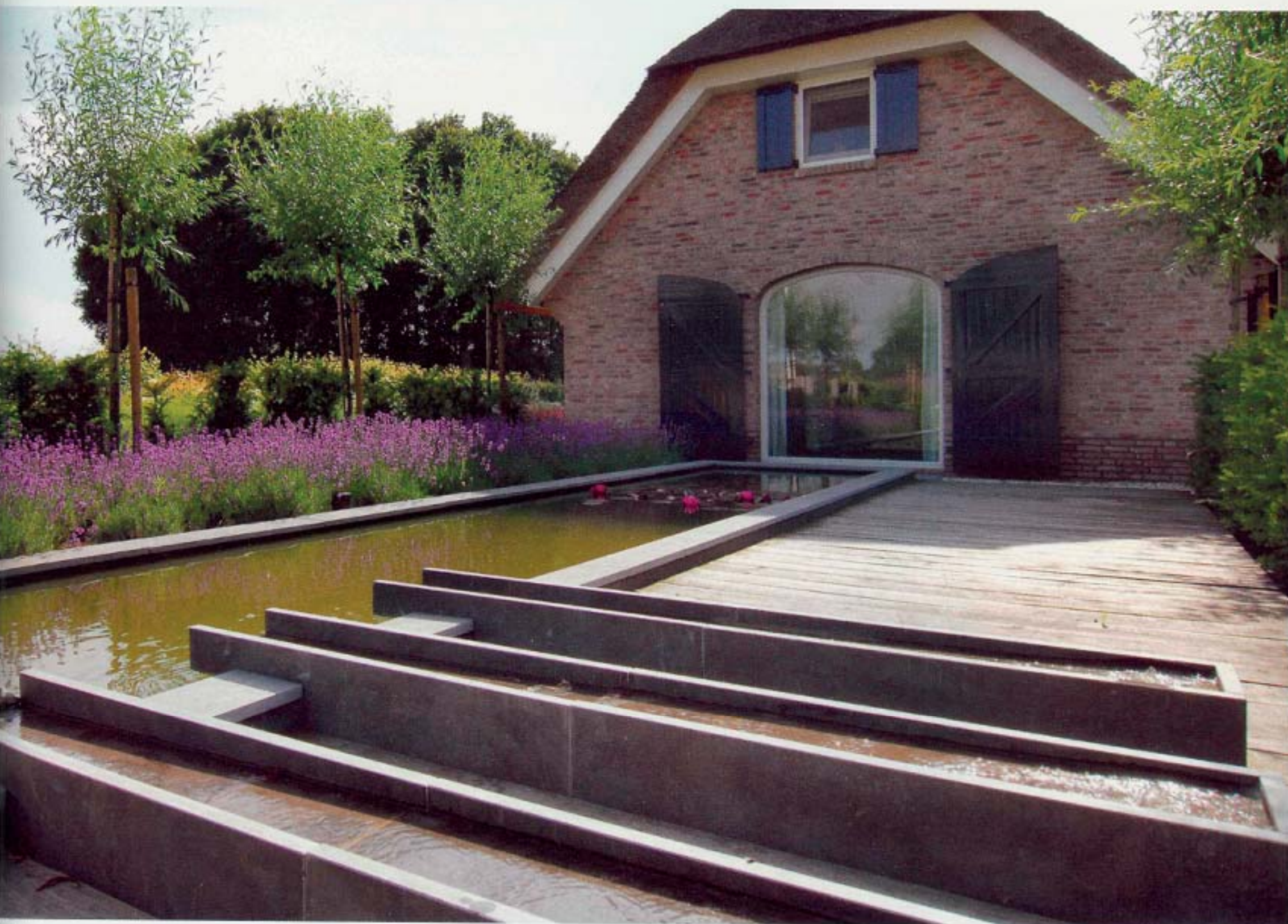
De strakke vijver levert vanuit de huiskamer een prachtige zichtlijn op.

landschap. Jan: "De vorige bewoners hadden de tuin zo ingericht dat er veel privacy was. Met een schutting en coniferenhagen was de tuin aan het zicht van voorbijgangers onttrokken. Maar dat betekende dat je vanuit huis en vanuit de tuin zelf ook niets van de mooie omgeving zag. En het was door de overdadige begroeiing binnen donker. We besloten dat de tuin meer op het landschap moest aansluiten. We hebben nog wel een beukenhaag bij de weg, maar verder kijken we heerlijk weg over de weilanden." Ook bij de beplanting en de indeling was de landelijke omgeving leidend. Als bestrating is gekozen voor grind en klinkers, rond het erf staan mooie houten hekken en een boomgaard mocht als tuinonderdeel niet ontbreken. In het plantplan werd gekozen voor echte boerenplanten. Frank: "We hebben