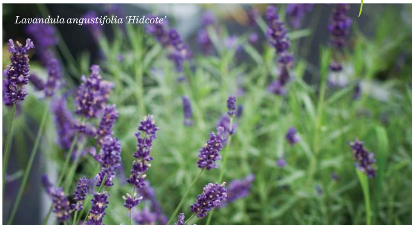
Lavandula angustifolia 'Hidcote'

Met sfeervolle, huiselijke accessoires maak je van je tuin een gezellige buitenkamer!