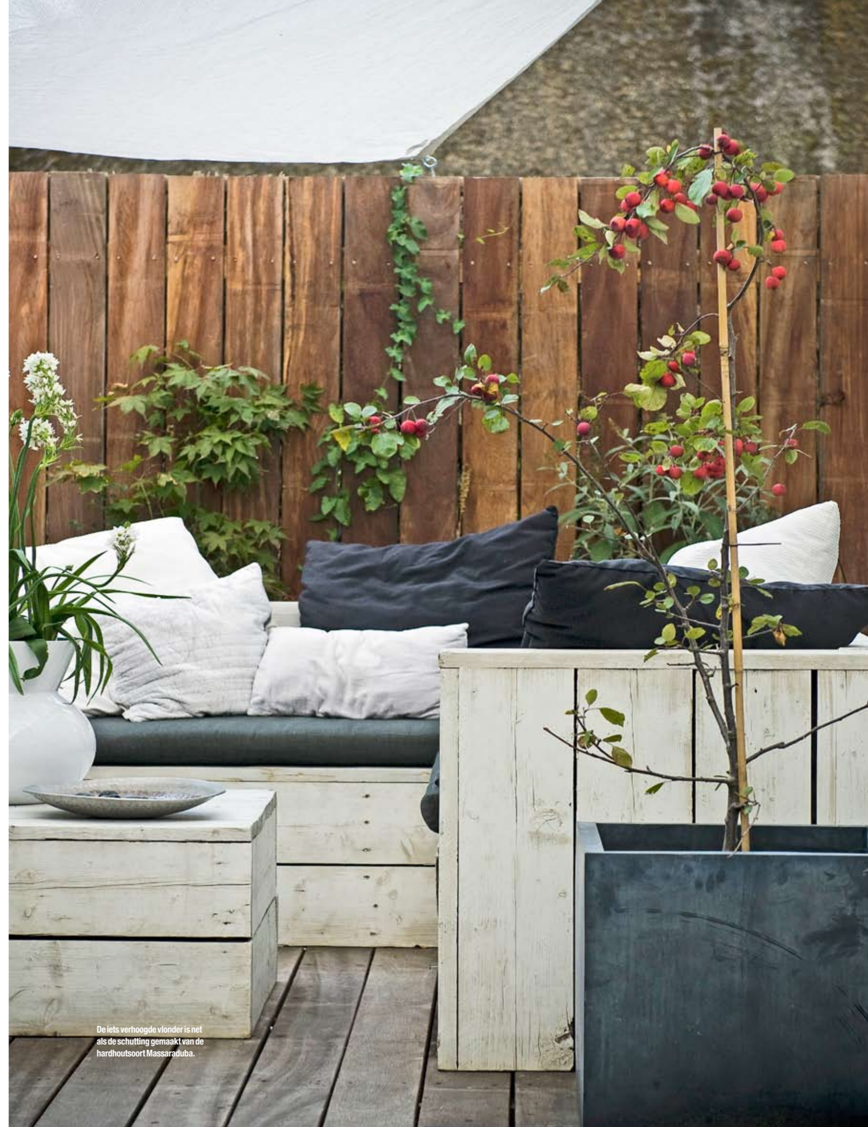
De iets verhoogde vlonder is net als de schutting gemaakt van de hardhoutsoort Massaraduba.