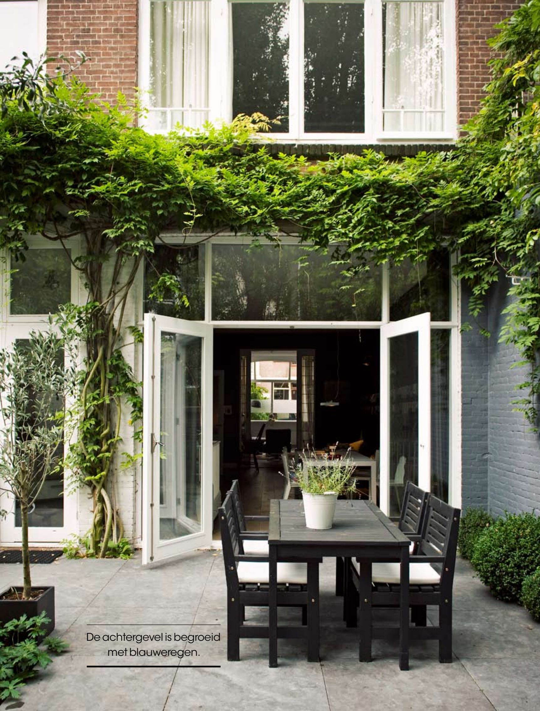
De achtergevel is begroeid met blauweregen.